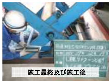
施工最終及び施工後

藤浪では、ホイストリフターの点検を行っております。整備不良における製品の落下などの事故発生を未然に防ぎます。大切な設備の長寿命化を図り、専門のサービスエンジニアが検査しますので不具合箇所の早期発見早期対応が可能となり無駄な維持費を削減することができます。