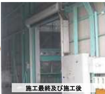
施工最終及び施工後