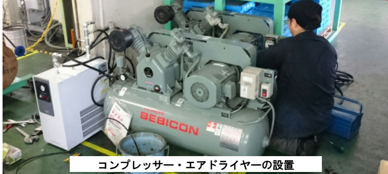
コンプレッサー・エアドライヤーの設置

藤浪では、コンプレッサーの長寿命化・省エネを実現するご提案を行っております。今回はお客様が各設備に対して各コンプレッサーを接続していたのですが、内1台のコンプレッサーが高付加により限度一杯で長期使用が難しい状態でした。そこで、コンプレッサーを直列に接続しエア使用量を分散させて、各コンプレッサーの負担を軽減し長寿命化への対策をしました。また、吐出エアの水分に対する対策がなくシリンダー等のエア機器のトラブルが発生する恐れがありエアドライヤーの設置も行いました。結果、コンプレッサーの吐出し空気量の改善によりエア機器の保護につながり、長寿命化・省エネを実現しました。一度、コンプレッサー関連の見直しをしてみてもはいかがでしょうか。コンプレッサーのお困りごとは実績豊富な藤浪にお気軽にご相談ください。