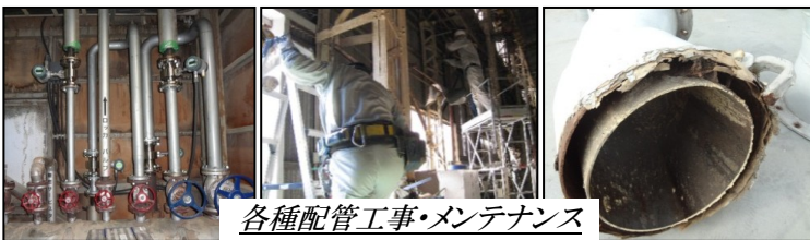
各種配管工事・メンテナンス

藤浪では、「工場の配管工事・メンテナンスサービス」を行っております。エア配管、油圧配管、水道配管、LPG 配管から、衛生面で高いレベルが要求される食品・飲料工場向けサニタリー配管工事まで様々な配管工事が可能な他、詰まりなどの問題にも迅速に修理対応いたします。また配管工事の際、メンテナンス作業のための架台・階段などの付帯設備の製作から据付まで藤浪が行いますので、お客様にご負担をかけません。工場の配管工事・メンテナンスにご関心がある方は、お気軽にご相談ください。