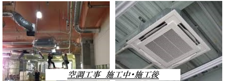
空調工事 施工中・施工後