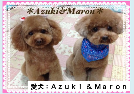
愛犬：Azuki & Maron